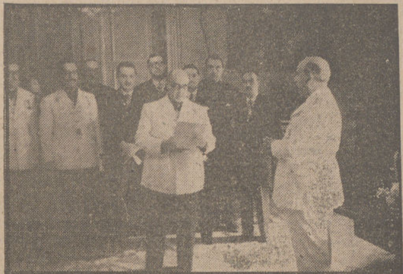
S. E. el Jefe del Estado concedió audiencia en el Pazo de Melrás a la Diputación provincial de La Coruña cuyo presidente dió lectura a la relación de obras efectuadas por dicho organismo en aquella provincia.