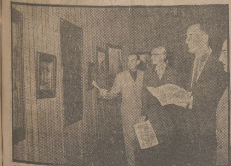
El ministro de Educación Nacional, señor Ruiz-Giménez, acompañado del delegado nacional del Frente de Juventudes y otras personalidades, durante su visita a la VIII Exposición Nacional de Arte del Frente de Juventudes, en Madrid.