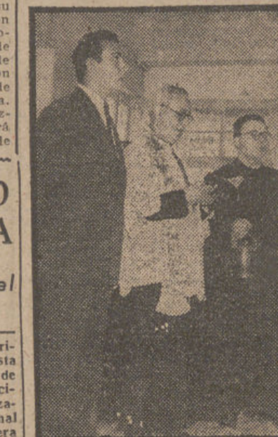
Momento de la entronización del Sagrado Corazón de Jesús en la nave principal.

SIDNEY, 22. (EFE).—Noticias procedentes de Adelaida dicen que varios cohetes con un peso de cinco toneladas cada uno, han sido descargados de un buque mercante inglés y enviados, al parecer, a Woomera, donde se van a celebrar pruebas atómicas. No se ha facilitado información.