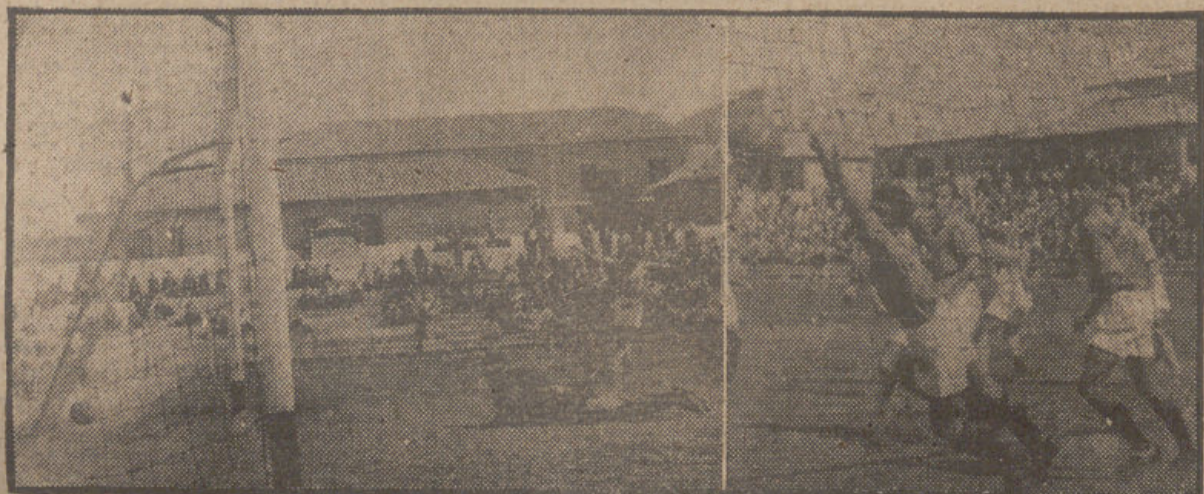
La cámara de Sanz ha captado estos dos goles recreativistas. En la fotografía de la derecha, uno de los defensas intentó, en un postre esfuerzo, detener el balón que había de llegar a la red. El portero fué burlado en el chut y se encontraba en el ángulo opuesto, por lo que no aparece en la "foto".