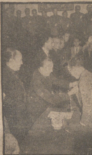
El ministro secretario general del Movimiento, señor Fernández-Cuesta, imponiendo diversas condecoraciones a los mandos nacionales del S. E. durante el acto de clausura de la reunión celebrada por aquéllos en Alcalá de Henares.

hecho para el abastecimiento de agua y viveres. A las sesiones del Congreso asistirán, por ahora, veinticinco gober-