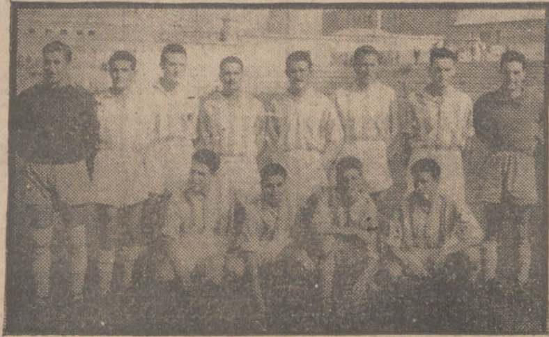
El Recreativo, que de forma tan magnífica ha iniciado su temporada en Tercera División, posa para PATRIA antes del mañanero encuentro frente al Ubeda, que había de finalizar con el fuerte tanteo de cinco goles a uno.