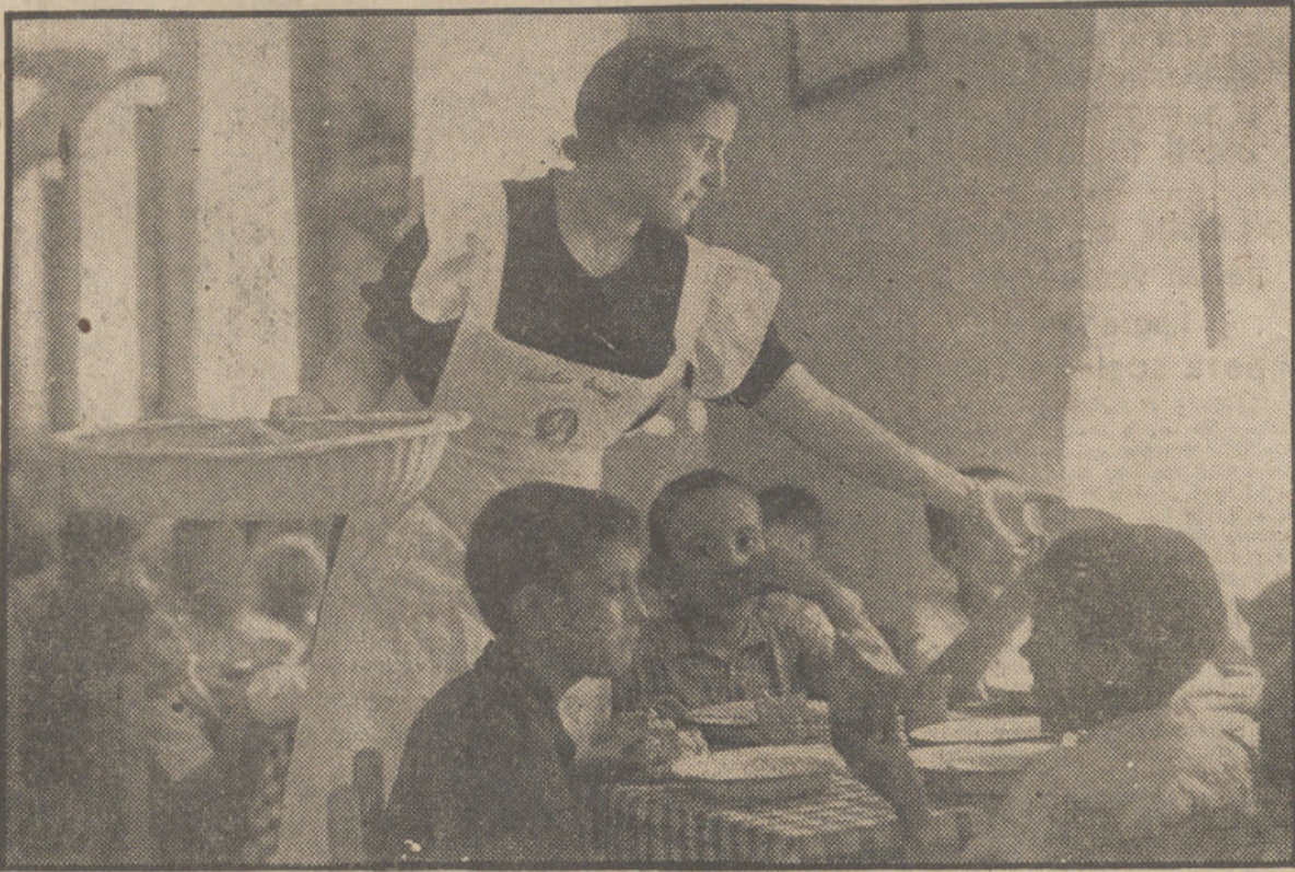
La hora del comedor, en uno de los Hogares granadinos de Auxilio Social.

Cerca de cinco millones de pesetas se invierten anualmente en atender los servicios montados en Granada y su provincia El Hogar de la Alhambra, considerado como uno de los mejores de España