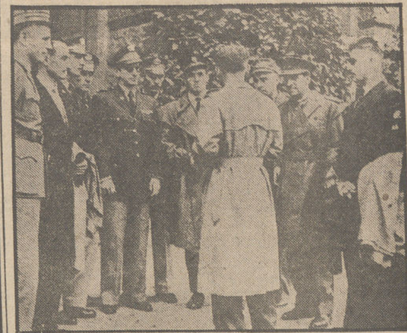
El Ayuntamiento de Berna recibió a los participantes en el campeonato mundial de pentathlon, que se disputará en Magglingen. En la foto se ven representantes de España, Suiza, Estados Unidos e Italia.