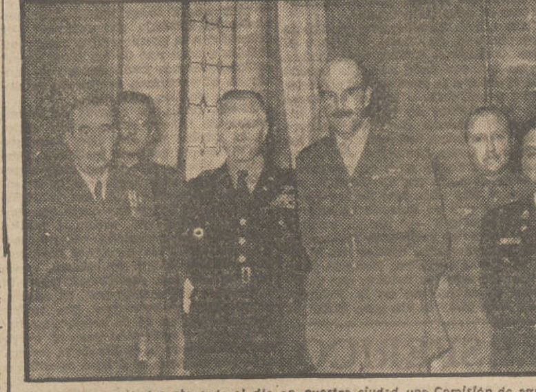
Ayer permaneció durante todo el día en nuestra ciudad una Comisión de agregados militares de las Embajadas de Madrid. Procedía de Málaga. Los agregados militares eran acompañados por jefes del Estado Mayor Central. Visitaron al Capitán general, señor Pimentel y Zayas. Nuestra primera autoridad militar compartió amablemente con los ilustres huéspedes, quienes también visitaron la fábrica nacional de pólvora y explosivos. Por la tarde recorrieron detenidamente nuestros monumentos históricos y artísticos, y al anochecer emprendieron viaje de regreso a Madrid.