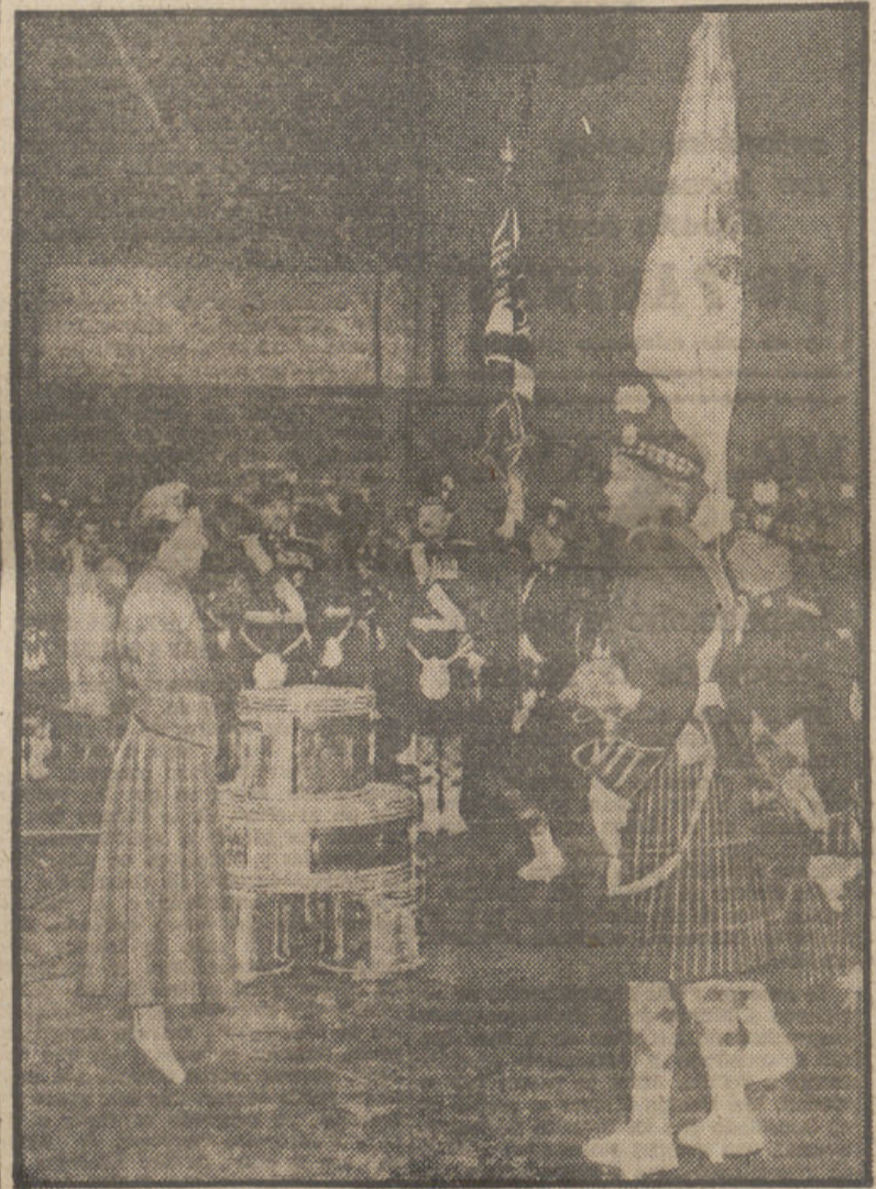
Sigue en el primer plano de la actualidad la princesa Margarita, hermana de la reina de Inglaterra. Esta vez cumpliendo sus obligaciones de coronel del batallón de Infantería ligera de Highland. La joven princesa vistió con tal objeto y con el de saludar a las nuevas banderas del batallón los cuarteles de Bulford Salisbury, en una de cuyas naves tiene la escena lugar.