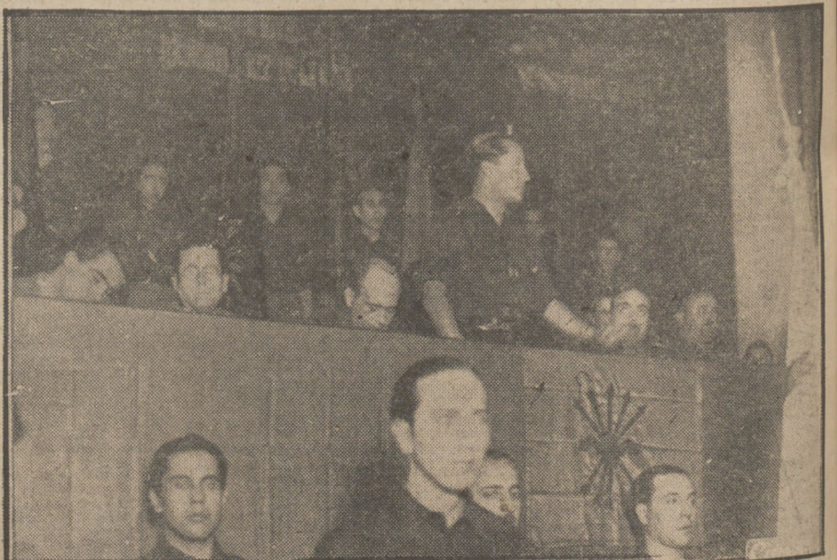
En el teatro de la Comedia, de Madrid, José Antonio Primo de Rivera, hace exactamente veintidós años, pronuncia el histórico discurso fundacional de la Falange. Al conjuro de su verbo, España empieza a ponerse en pie, camino de la victoria.