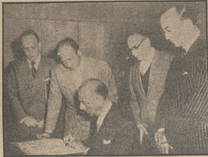
Don José Sebastián de Erice, observador oficial de España en la Organización de las Naciones Unidas, firma, junto a otros miembros de la misma, los protocolos relativos al control de productos tóxicos.