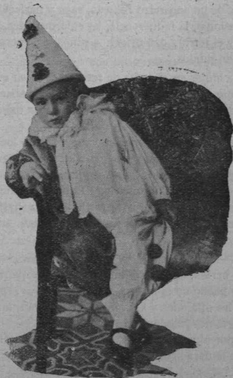
Niño de dos años