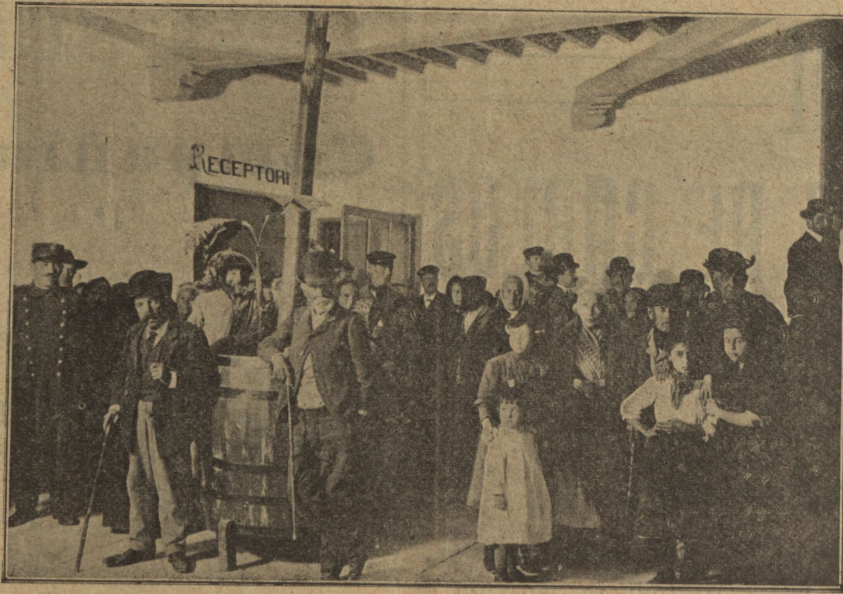
Entrada de los acogidos en el primer patio.

Iberia es una provincia botánica de Africa, viviendo en ella espontáneamente, como en su propia patria, toda la flora transpetana, encontrándose en Andalucía, especies desconocidas en Europa y comunes en el Sahara; la meteorología marroquí y la meteorología española forman una misma y sola meteorología; los labradores de aqueude y allende cultivan unas mis-