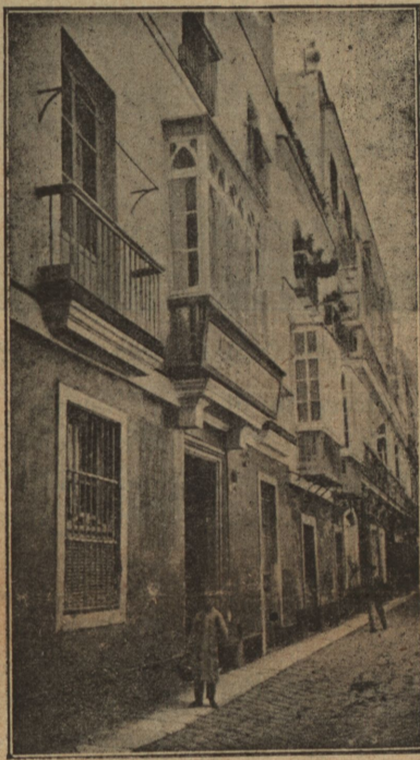
Fachada del edificio.

Con posterioridad á esto que escribimos, merced al concurso de las au-