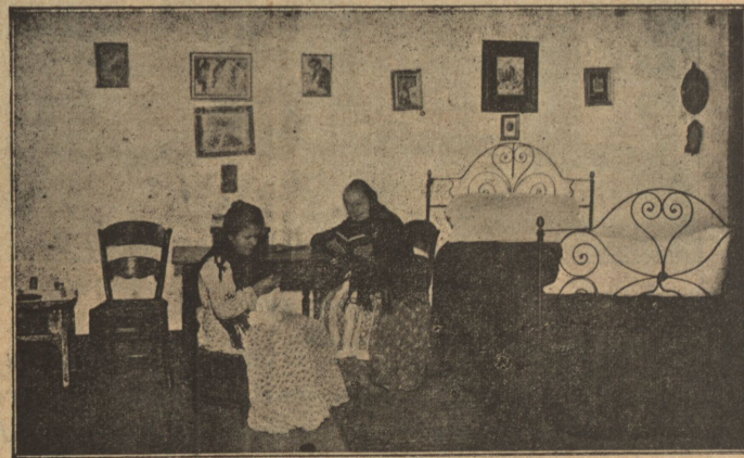
Interior de una habitación.

tro juicio, es una de las instituciones que mayores beneficios reporta á los desheredados de la fortuna.