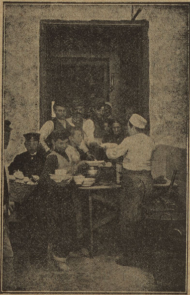
Distribución de la comida.

Al Sr. Alcalde toca el resolver pronto y bien el problema que en Cádiz se presenta.