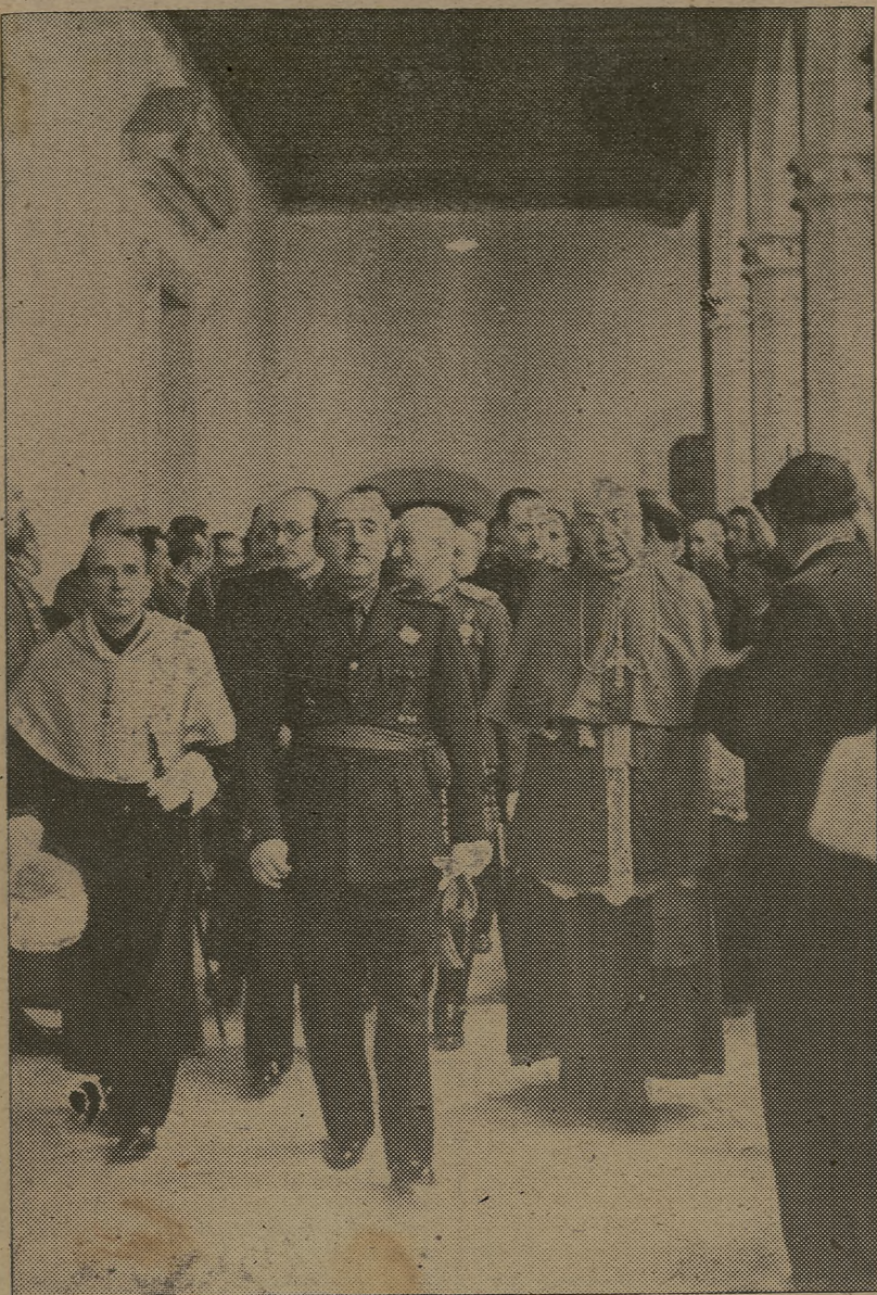
S. E. el Jefe del Estado, Generalísimo Franco, ha presidido en la Universidad, reconstruida después del incendio que hace dos años destruyó parte del histórico edificio, la apertura del curso universitario. El Generalísimo Franco en su visita al edificio.