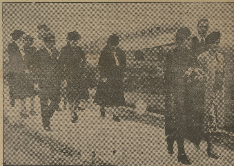
La delegada nacional de la Sección Femenina, Pilar Primo de Rivera, llega a Lisboa.

Termina diciendo que estas compras continúan, a pesar de la prohibición decretada sobre la exportación de capitales. Efs.