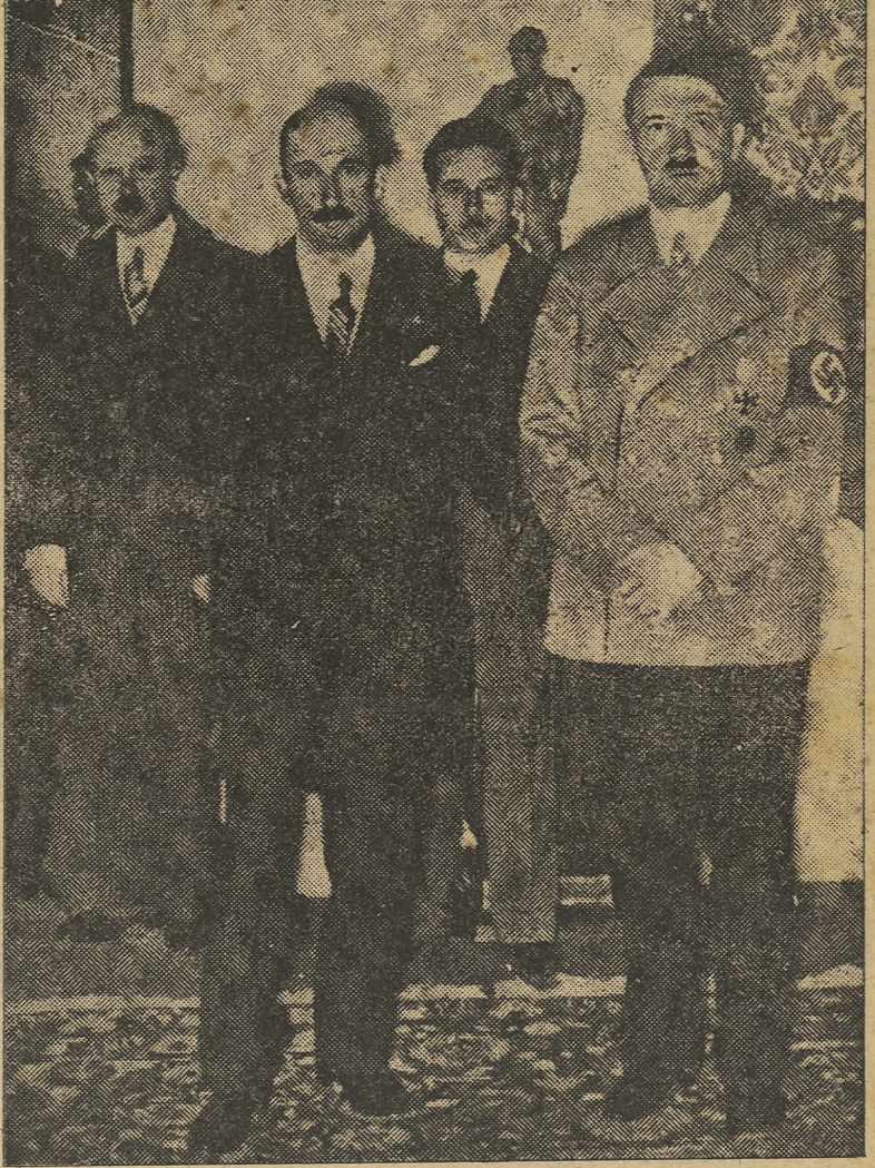
Adolfo Hitler y el rey Boris de Bulgaria, durante la última entrevista que tuvieron en Berlín.

Dió también cuenta de las gestiones llevadas a cabo para la participación de Rumanía en la feria de Leipzig. Efe.