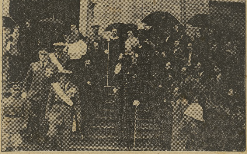
Los funerales por S. M. don Alfonso XIII. El infante don Alfonso de Orleans y las autoridades, al salir de la R. e I. I. Colegial después de los funerales oficiales.