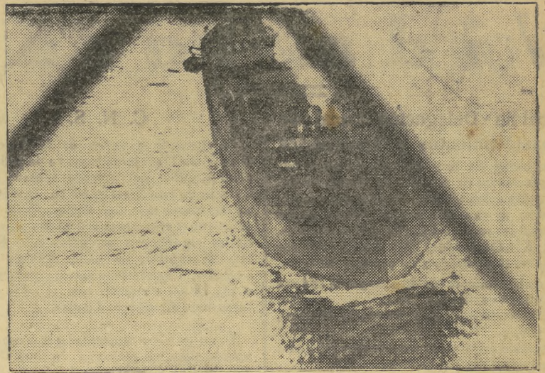
Un mercante inglés descubierto por un avión alemán, es bombardeado e incendiado

El gobernador civil ha añadido a la colección una moneda árabe de plata de un reino de Taifas de la dominación árabe.