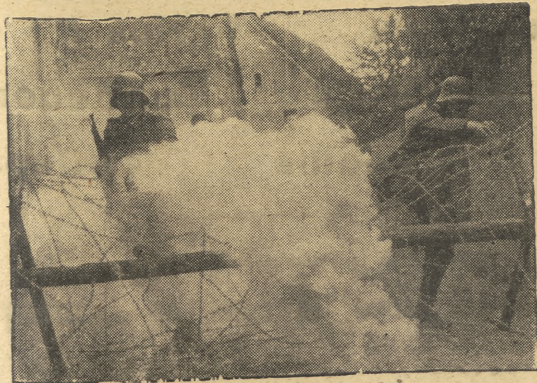
Los soldados alemanes llegan a las alambradas rojas para tomar al asalto una posición

La defensa antiárea finlandesa de Carelia oriental, derribó a otros cinco aviones enemigos de diferentes tipos, y obligó a tomar tierra a dos hidroaviones enemigos cuya tripulación fué capturada. Efe.