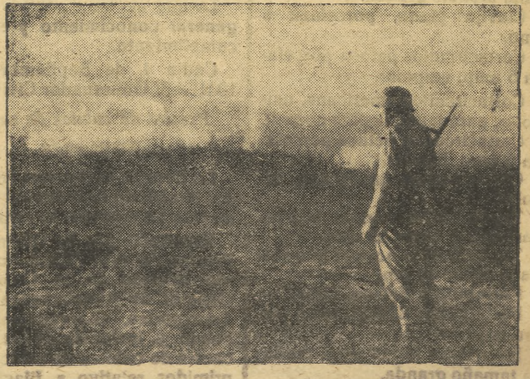
Aldeas incendiadas caracterizan la retirada roja. Los soldados que hacen la centinela contemplan el humo de los incendios