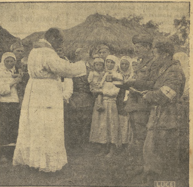
Los italianos en el frente ruso.—En Ucrania, primera cura a los prisioneros soviéticos por la Sanidad del cuerpo expedicionario italiano.—Un capellán militar administra el bautismo a un pequeño nacido durante el dominio ruso.