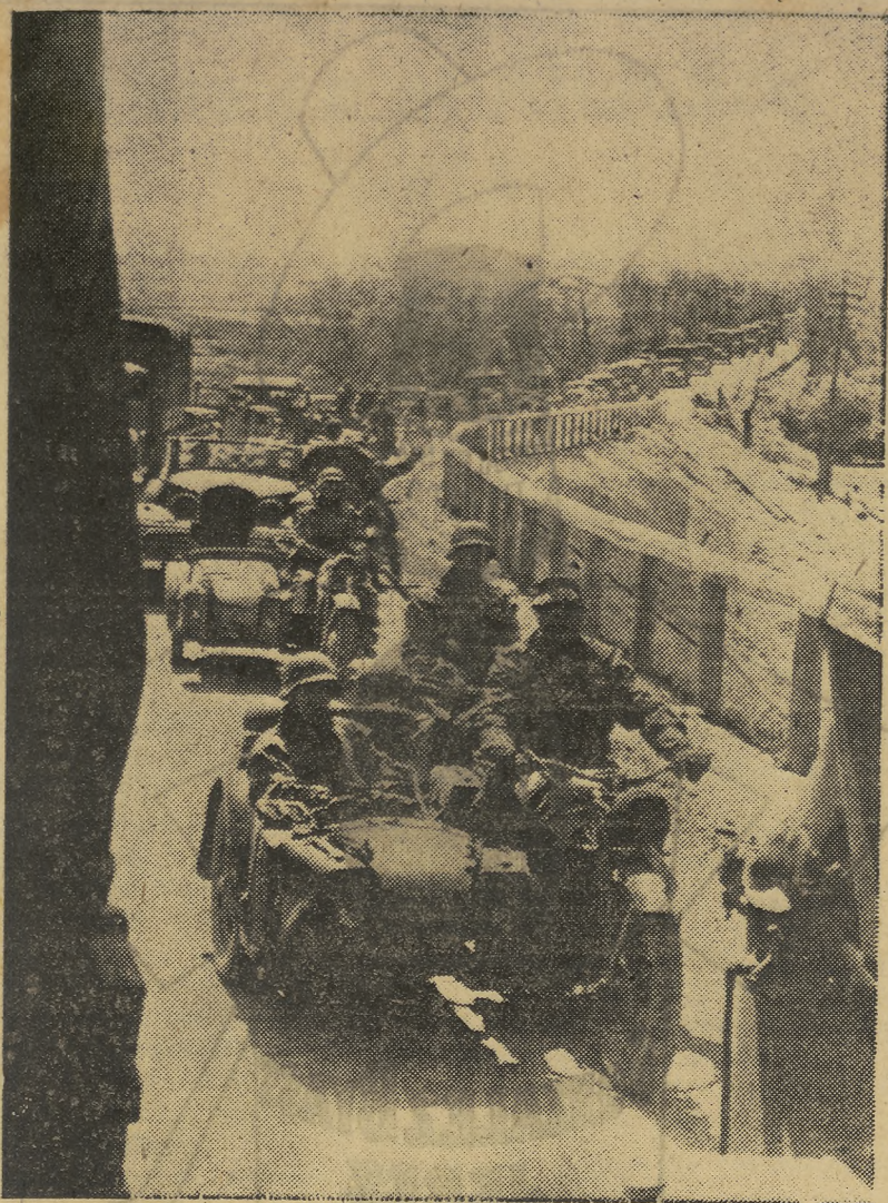
Columna motorizada alemana avanzando en el frente central de Rusia.

cit a estos condiciones del Comi- ZLIUS.