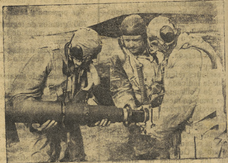
Reporters cinematográficos del Ejército alemán instalan en la cámara un teleobjetivo para tomar vistas de los bombardeos de Moscú

El Cairo.—Comunicado del Gran Cuartel General británico de Oriente Medio.—Libia.—Nuestras patrullas continúan desplegando actividad en Tobruck y en la región de la frontera. Durante los combates victoriosos contra las fuerzas enemigas que atravesaron la frontera el día 14 unidades mecanizadas británicas y surafricanas capturaron diez carros de combate e incendiaron un vehículo blindado. Efe.