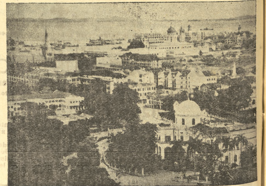
Una vista de la ciudad de Singapur

Sobre el Norte de Alemania fueron derribados cinco aviones británicos que formaban parte de la escuadrilla que bombardeó algunas aglomeraciones urbanas.—Efe.