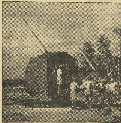
Modernos cañones antiáereos cubren el territorio de Singapur, formando una red imponente

el viaducto hasta Changi permite la navegación y el atracó de barcos de gran tonelaje. En ella se hallan las defensas de Singapur contra los ataques que puedan amenazarla desde tierra. A este efecto el Canal puede dividirse en tres partes. Los astilleros de Seletar unidos por vías de ferrocarril a la línea principal antes mencionada, de la que distan cuatro millas. Frente a ellos se extiende una extensa bahía, que por la profundidad de sus aguas puede albergar una flo-