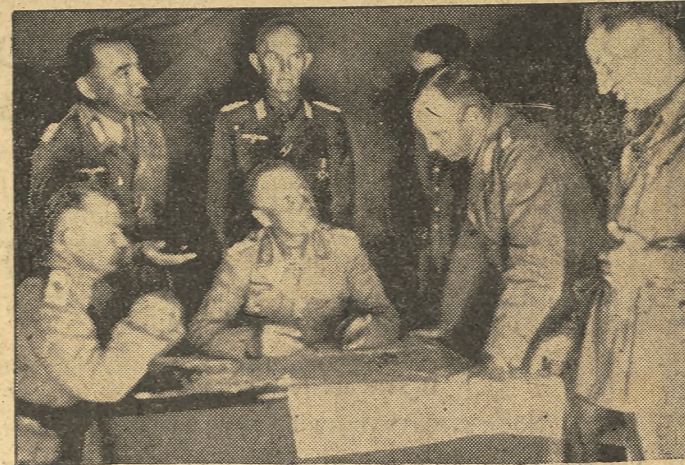
El victorioso teniente general Rommel, jefe de las tropas del Eje en África, planea las operaciones sobre la carta militar, con los jefes de su Estado Mayor, compuesto por militares alemanes e italianos.

Permanecerá en la capital durante el día de hoy.