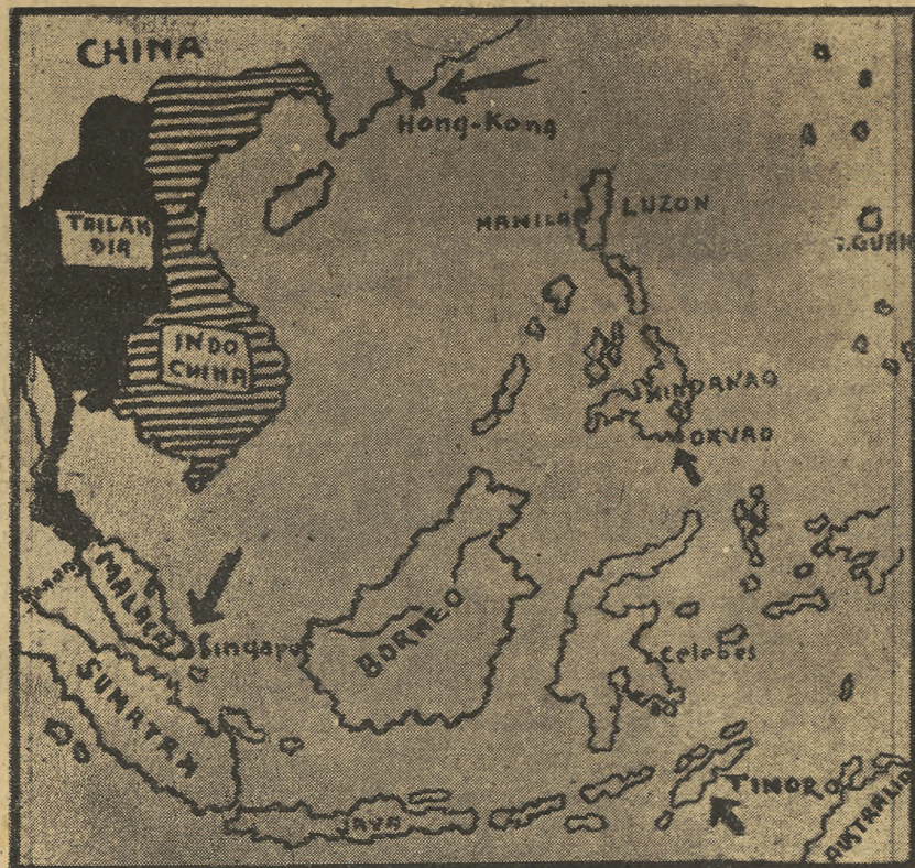
La conquista de Singapur y los desembarcos en Sumatra, Java, Borneo, las Célebes y las Molucas suponen la ocupación por el Japón de una serie de puntos estratégicos de gran importancia para las futuras operaciones

Singapur.—El hecho de que se haya reanudado el servicio del ferrocarril malayo, que recorre 700 kilómetros desde la frontera birmana hasta Singapur, constituye una prueba de la rapidez con que se efectúan los trabajos de reconstrucción en la zona de guerra.—Efe.