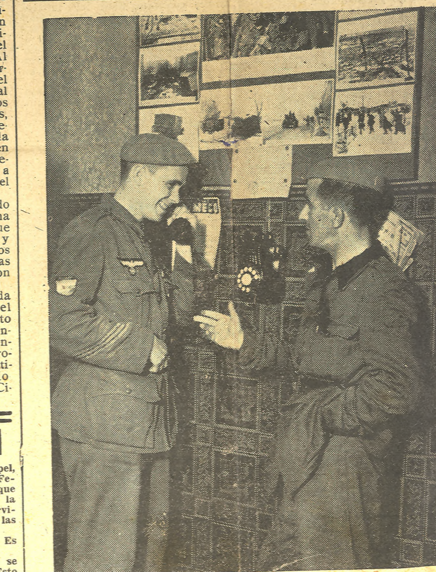
EN EL HOGAR DE LA DIVISION AZUL. - De regreso de Rusia, estos combatientes de la División Azul, se detienen unos momentos en Madrid para seguir camino a sus respectivas residencias.

Tres barcos contra incendios y ocho bombas del Cuerpo municipal de Bomberos, han tomado parte en la extinción del fuego, que, según manifestaban los técnicos, debió comenzar en un departamento de la sala inferior.—Efe.