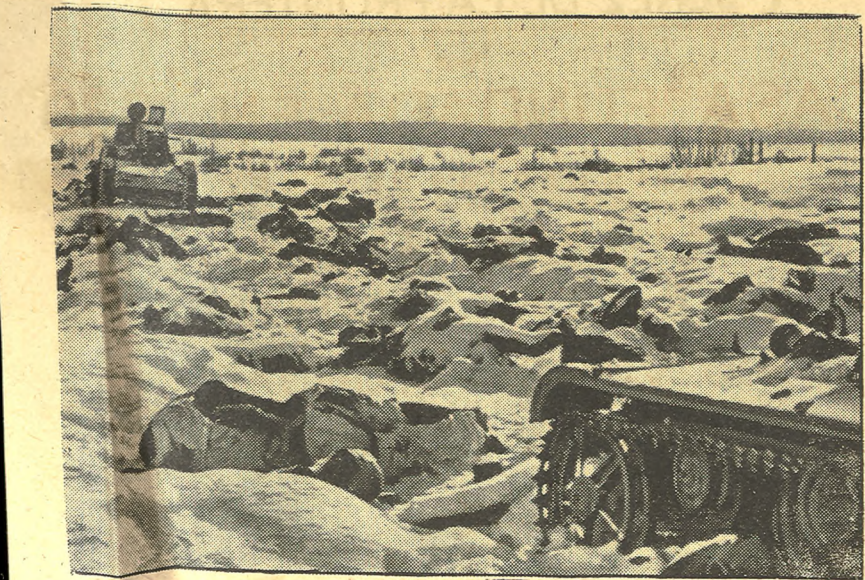
Un documento palpable de la derrota de los intentos bolcheviques en el invierno lo tenemos en esta vista de la estepa nevada rusa, sobre la que yacían las víctimas humanas y de material de uno de los ataques.

por ANDRES GAYTAN es un desvivirse, un avanzar hacia lo incognoscible. Pueblo sentencioso que se sienta a la puerta de la tienda para ver pasar a su enemigo a hombros de celestial venganza. Y sentencia, es lo inapelable, lo que le cierra resquicios a la esperanza, lo que prepara a morir bien. El bien morir es ya cristiano, sin remisión. Por eso, a veces, nos hemos extrañado nosotros, gentes de arriba, del profundo sentido de una copla flamenco, y eso no es cosa que se fabrique a puertas cerradas, bien sea en una Sinagoga o en un colmado. Necesita por techo el cielo y por suelo el desierto, para mejor sentirse desamparado. Por esto lo hemos comprendido tú y yo ahora que estamos cercados por la lejanía, y ahora que nos guarda la Muerte en una chopera ese oasis del desierto, al revés que es la estepa, resulta algo perverso el cante. —Si contestó el de la pelada plancie castellana—, es perverso y poco cristiano. Es pesado, pero al pasar a las venas ibéricas, se hace copado venial en lugar de pecado original, y pierde virulencia al mezclarse con la Manzanilla, que en este caso es un antídoto. Es casi casi una mezcla explosiva. Rusia, abril 1942.