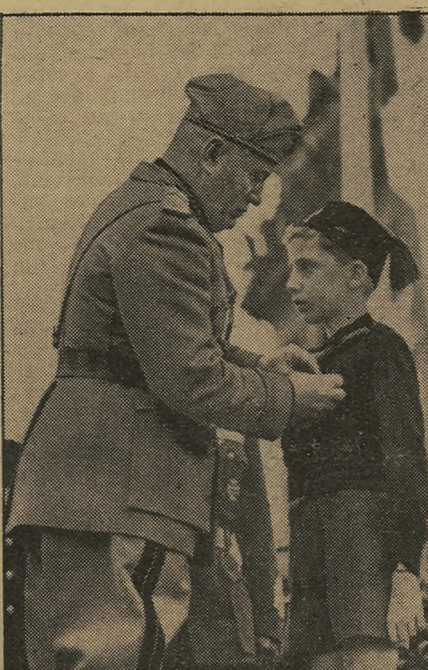
En memoria del fallecido mariscal Italo Balbo, el Duce condecora a su hijo en el aniversario de la fundación de la Aviación italiana.