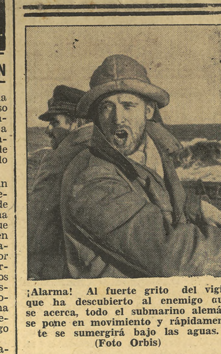
¡Alarma! Al fuerte grito del vigía que ha descubierto al enemigo que se acerca, todo el submarino alemán se pone en movimiento y rápidamente se sumergirá bajo las aguas.

Vichy.—Se ha publicado el siguiente comunicado oficial acerca de la ruptura de relaciones diplomáticas de Francia y África del Sur. El Gobierno de la Unión Surafricana acaba de notificar al ministro de Francia que ha acordado romper las relaciones diplomáticas con el Gobierno francés. Ello no ha hecho sino confirmar la situación existente desde hace dos años. Las relaciones entre los dos países estaban rotas desde julio de 1940.—Efe.