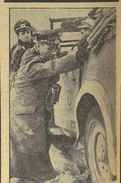
El auto del general Rommel se ha quedado atascado en la arena del desierto africano, y el mismo presta ayuda para sacarlo adelante.

En las demás regiones, nada que señalar."—Efe.