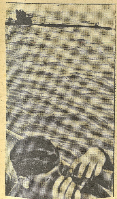
Un encuentro en alta mar de dos submarinos alemanes; pero no por eso deja de cumplir su obligación este observador, que escruta el horizonte por si hay a la vista un enemigo.

SUPPLICAN una oración por su alma y la asistencia a tan piadoso acto.