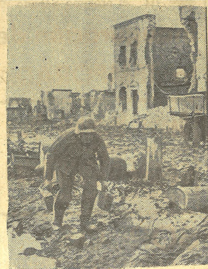
Soldados alemanes avanzando cautelosamente por un pueblo soviético, en el cual aún se esconden algunos núcleos soviéticos. Como se ve en la foto, el pueblo está totalmente en ruinas.