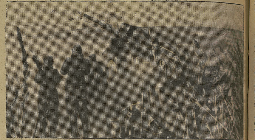
Artillería antiaérea alemana haciendo fuego contra las defensas soviéticas de Malgotek, en el frente caucásico.

Los cazas alemanes han proseguido sus ataques diurnos contra la costa meridional de Inglaterra y han bombardeado abjetivos ferroviarios.—Efe.