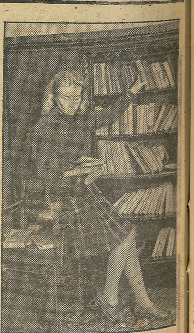
En la actual colecta de libros para los soldados alemanes, toda el mundo hace su ofrenda a los que dan su sangre generosa en los frentes

El «Popolo d'Italia» declara: «Cuanto más encarnizada y cruel sea esta guerra, tanto más se estrechará el pueblo italiano en torno a su Duce, con el determinado propósito de probar con las armas la fidelidad hacia sus ideales.»—Efe.