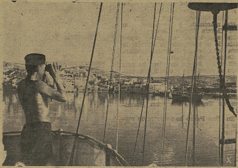
LA GUERRA NAVAL CONDUCE A LOS MARINEROS A LOS LUGARES MÁS LEJOS

Las fuerzas armadas aéreas han (Pasa a sexta plana)