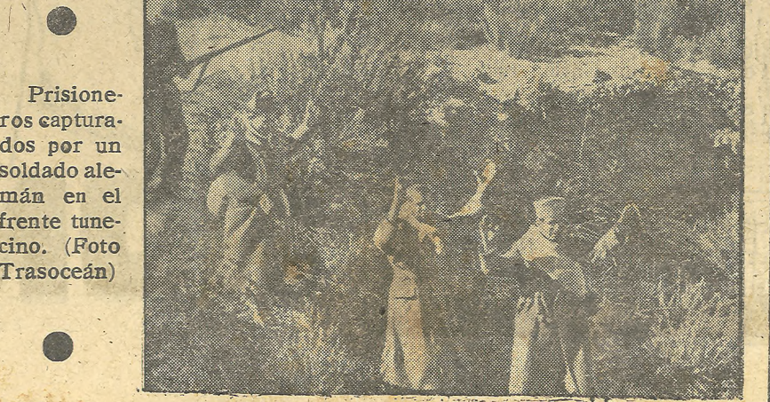
Prisioneros capturados por un soldado alemán en el frente tunecino.

BOMBARDEO INGLES A SAINT NAZAIRE Londres.—Oficialmente se anuncia que la aviación aliada ha lanzado sobre Saint Nazaire mil toneladas de bombas explosivas en catorce minutos.—Efe.