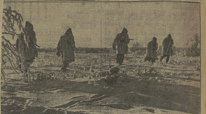
Con las armas preparadas esta patrulla alemana de exploración recorre el sector encomendado a su vigilancia para impedir las maniobras del enemigo.