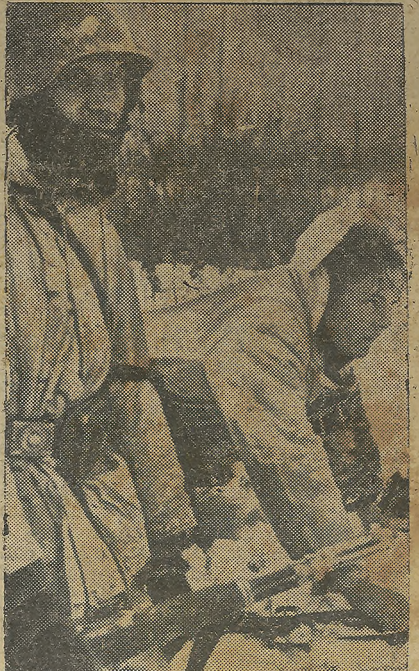
Estos dos soldados alemanes se preparan para pasar a rastras a la posición avanzada, cuyo campo está batido por el enemigo.