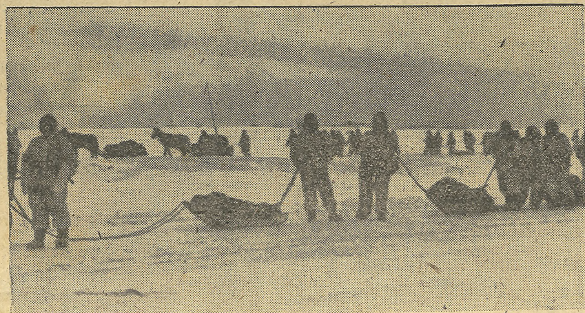
En las estepas heladas de Rusia los soldados alemanes llevan los aprovisionamientos para las líneas avanzadas, en los pequeños trineos del país, que ellos mismos arrastran. (Trasocacán)