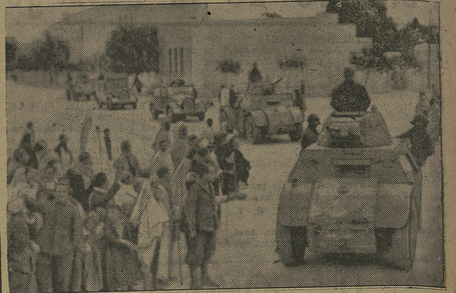
Una columna motorizada italiana pasa por una ciudad del Sur de Túnez, después de su conquista por las fuerzas del Eje.