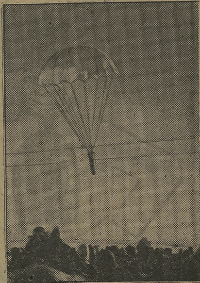
Aprovisionamiento de avanzadas alemanas por bombas lanzadas con paracaídas. En el interior de las bombas van provisiones.