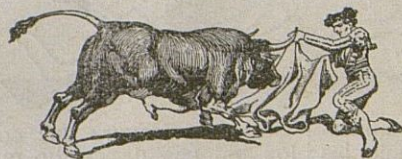
El valor de Ramón de la Cruz.

Cuando el día de la Sierra abandonábamos la plaza de toros después de la corrida, solamente sacábamos esta impresión: el valor de Ramón de la Cruz.