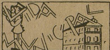
El Apéndice al Padrón de Edificios y Solares.

Todas las noches desfilan por el templo do Ntra. Sra. de la Asunción incontable número de fieles para rezar ante el altar de nuestra idolatrada Patrona.--Fiestas en La Esperanza en honor de la Virgen del Rosario.--El domingo se disputaron una bonita copa los equipos locales de fútbol La Purísima C.F. y C. D. Frente de Juventudes o o o.