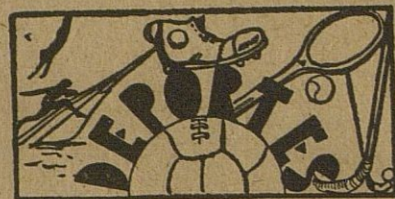
FÚTBOL.—La Purísima C. F. 4 C. D. Frente de Juventudes 0

Beba FINO CORTIJERO Y ahorrará su dinero Bebiendo de lo mejor... Sólo cuesta 60 cts. la copa en el mostrador de cualquier BAR.