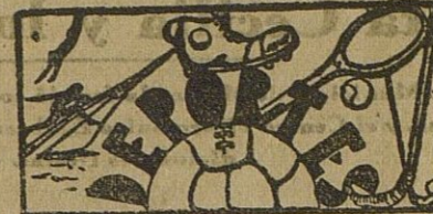
Partido de fútbol

El pasado domingo se celebró en el Campo de Villa Lourdes un encuentro entre los equipos locales Billaristas C. F. y C. D. Frente de Juventudes, los cuales se disputaban el título de campeones egabrenses.