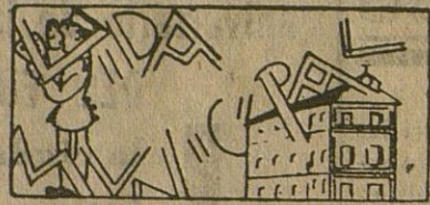
Al cobro los recibos de la renovación de sepulturas.

En período voluntario se está cobrando el 4.º trimestre de las contribuciones al Estado, que expira el día 10 del próximo Diciembre.—Una interesante nota de la Comisaría Provincial de Recursos sobre las tarjetas de aceite para los productores, familias y obreros.