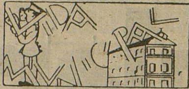
La pavimentación de la calle Córdoba