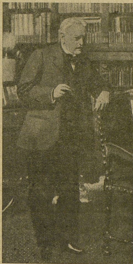
El gran polígrafo egabrense Don Juan Valera