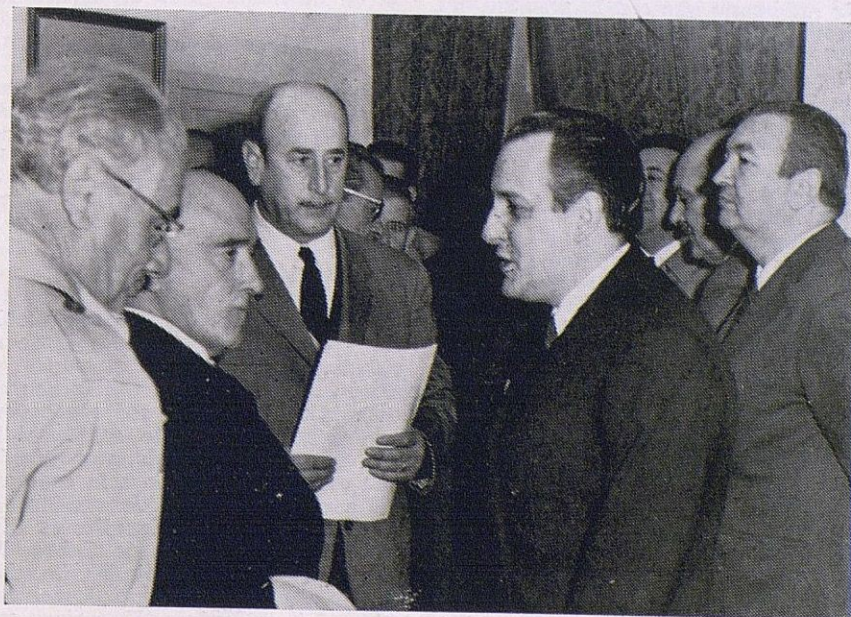
El gobernador civil y autoridades conversan con el alcalde sobre problemas de interés local.

Se honra hoy la ciudad de Cabra en recibir a la primera autoridad de la provincia que inicia aquí el conocimiento de estos pueblos nobles y leales que jalonan la geografía cordobesa. Al iniciar esta ruta, Cabra, con alegría, le expresa su cordial bienvenida y le ofrece respe-