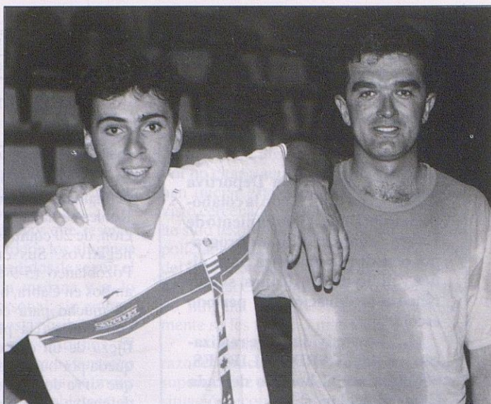
Campeón (camiseta blanca) y subcampeón de Tenis 1993.

Con 42 ajedrecistas venidos desde Cabra, Puente Genil, Montilla, Priego de Córdoba, Rute, Nueva Carteya, Carcabuey, Córdoba capital, se celebró el 5 de Sep-