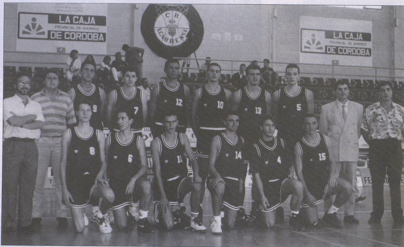
Presentación Oficial del Club de Baloncesto Egabrense

Presentación oficial de LA CAJA-CABRA con el histórico espectáculo de la ACB de "por medio": UNICAJA-POLTI frente a JUVER MURCIA.