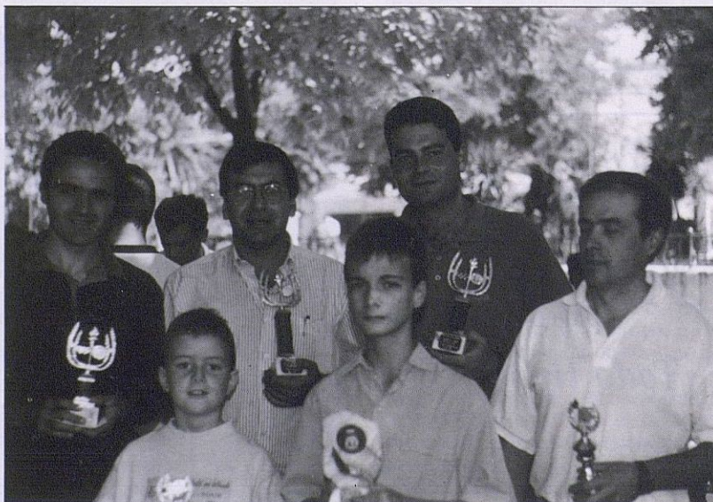
Campeones locales de Ajedrez