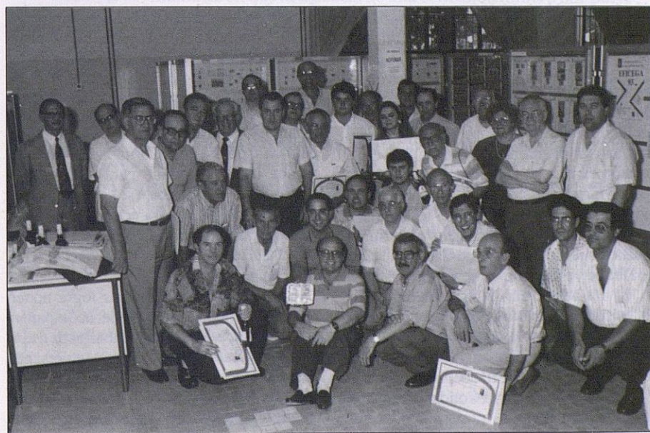
Parte de los expositores de EFICEGA '93.